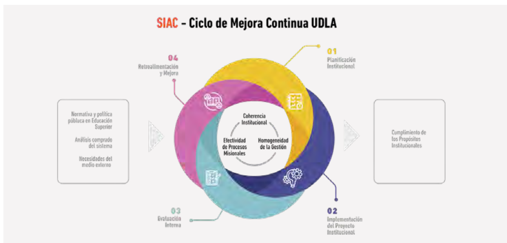
Figura 3. Sistema Interno de Aseguramiento de la Calidad