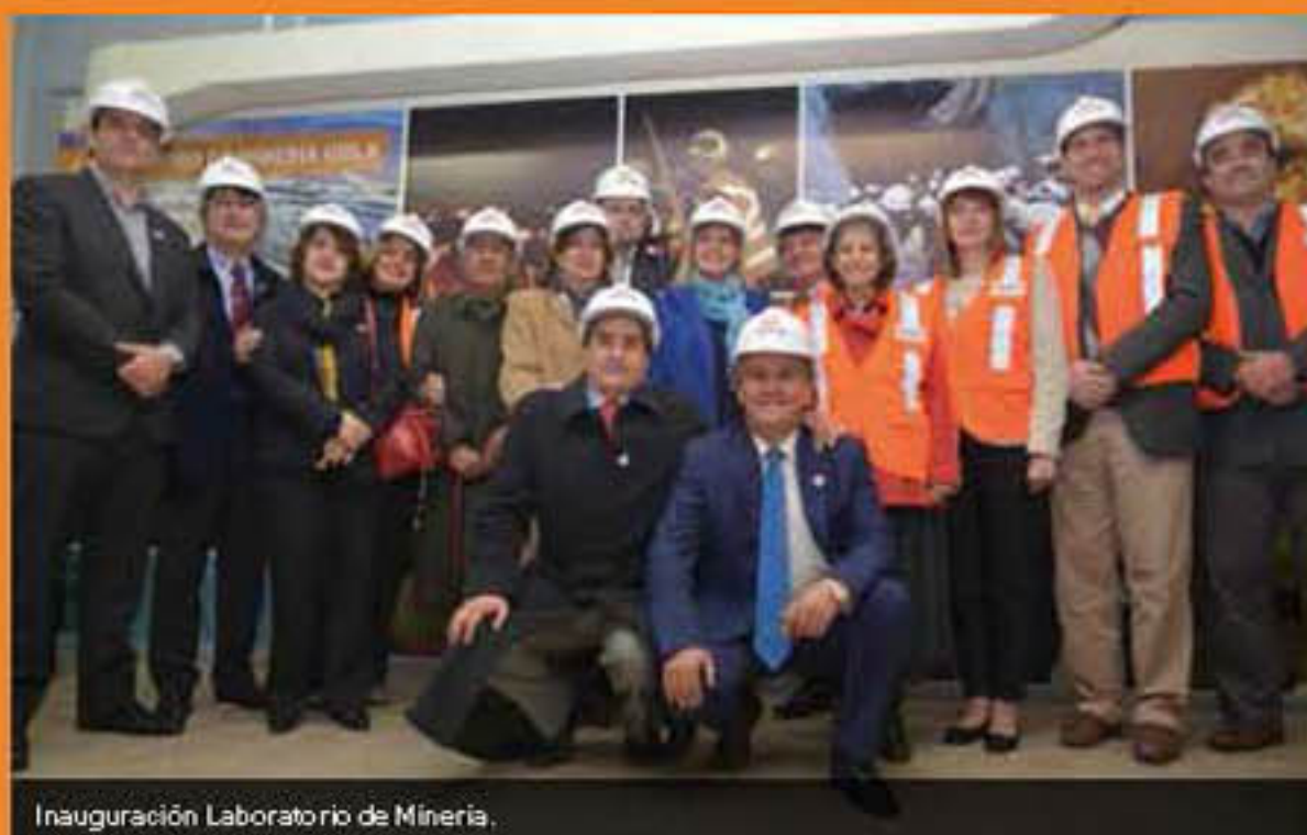
Inauguración Laboratorio de Minería.