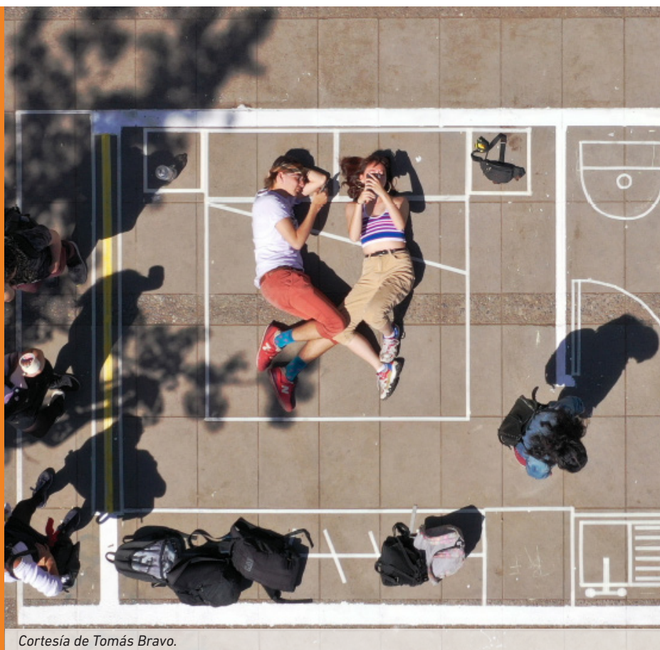
Cortesía de Tomás Bravo.

Por su parte, Carlos Aguirre, apuntó que la publicación "es sumamente contingente, porque desde un análisis heterodoxo y de varios referentes teóricos, es capaz de explicar la producción inmobiliaria del espacio".